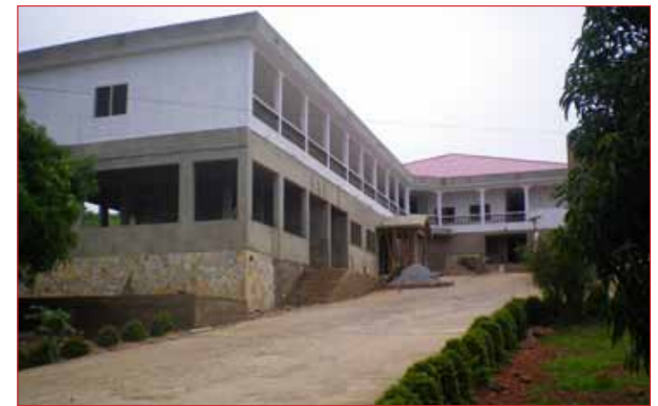
Der Neubau ist voll im Zeitrahmen: Die neue Mutter-Kind-Klinik in Atakpamé wird im Frühsommer 2015 fertig sein.

Montag fuhren wir noch einmal nach Atakpamé. Hier besuchte wir das Lycee - Agbonou und freuten uns über ein Treffen mit den beiden Deutschlehrern. An-