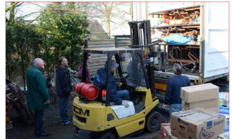
Viele fleißige Helfer sind in Dingden mit dabei, als der Container beladen wird. Die Gebrauchsgegenstände für den alltäglichen Bedarf gehen per Schiff auf den Weg nach Togo.