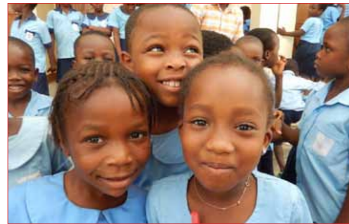
Drei Mahlzeiten bekommen die Kinder in der Ganztagschule in Be-Klikame, wo viele unserer Patenkinder unterrichtet werden.